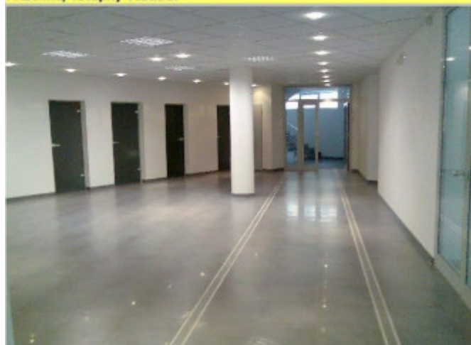
prizemie, vstupný vestibul