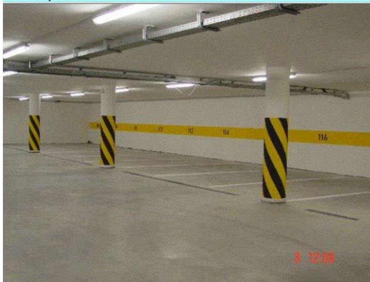
Garáže - pohľad 1