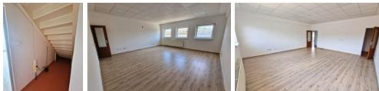
kancelária 118 - 26,6m 2