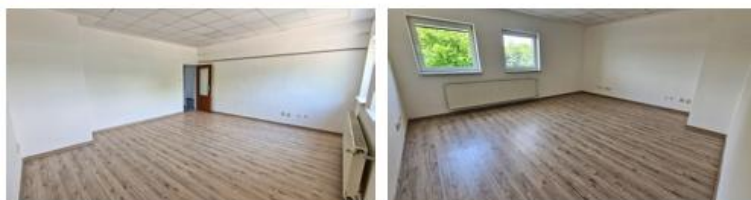
kancelária 201 - 66,4m 2